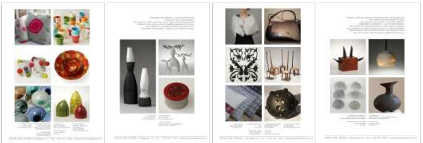
Fjórar af sex síðum HANDVERKS OG HÖNNUNAR í REYKJAVÍK LIVING 2009

HANDVERK OG HÖNNUN hefur kynnt íslenska hönnun og handverk í tímaritinu REYKJAVÍK LIVING sl. 7 ár. Árið 2009 var HANDVERK OG HÖNNUN með 6 síður í tímaritinu. Þessu tímariti er dreift á öll hótélherbergi í Reykjavík og stærri hótél úti á landi.