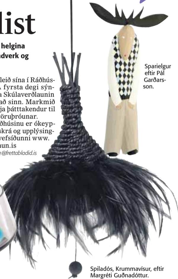
Sparielgur eftir Pál Garðars-son.