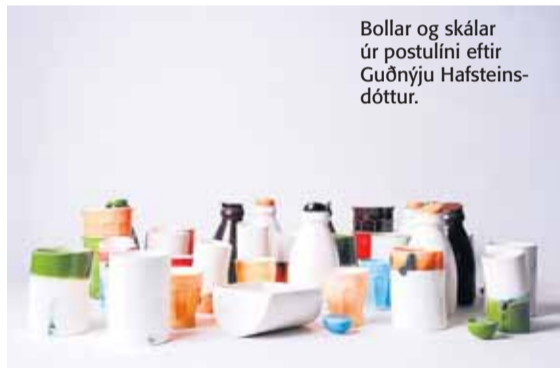
Bollar og skálar úr postulínu eftir Guðnýju Hafsteinsdóttur.