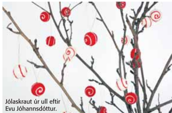
Jólasakra úr ull eftir Evu Jóhannsdóttur.