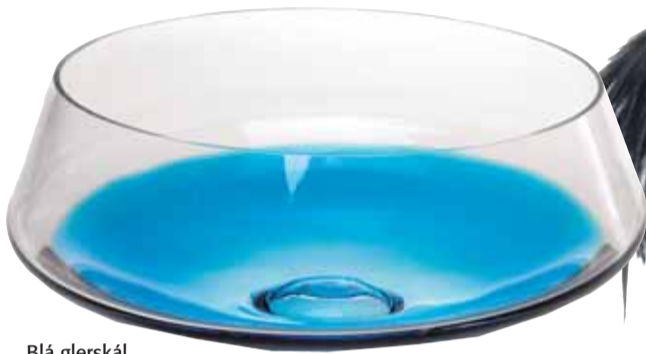
Blá glerskál eftir Kristínu Sigfríði Garðarsdóttur.